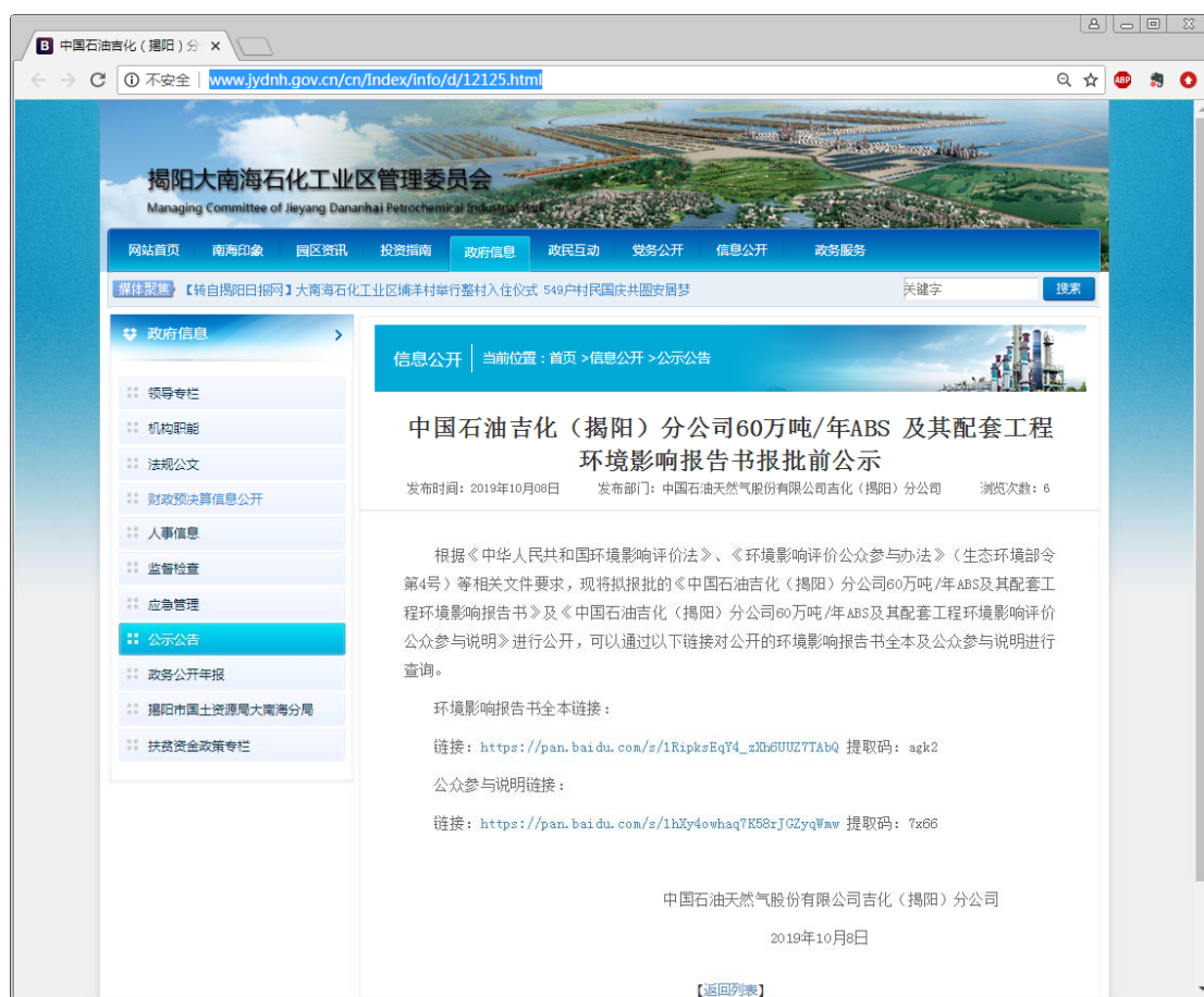
图 6-1 报批前公开

按照《环境影响评价公众参与办法》要求，在建设单位向生态环境主管部门报批环境影响报告书前，需通过网络平台对环境影响报告书全本和公众参与说明进行公示。本项目于 2019 年 10 月 8 日在揭阳大南海石化工业园管理委员会网站（ http://www.jydnh.gov.cn/cn/Index/info/d/12125.html ）进行了公开。