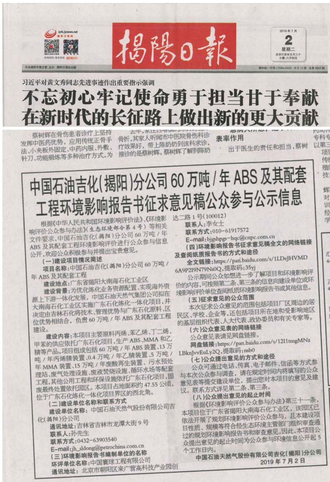
图 3-2 征求意见稿报纸公示 (7 月 2 日)