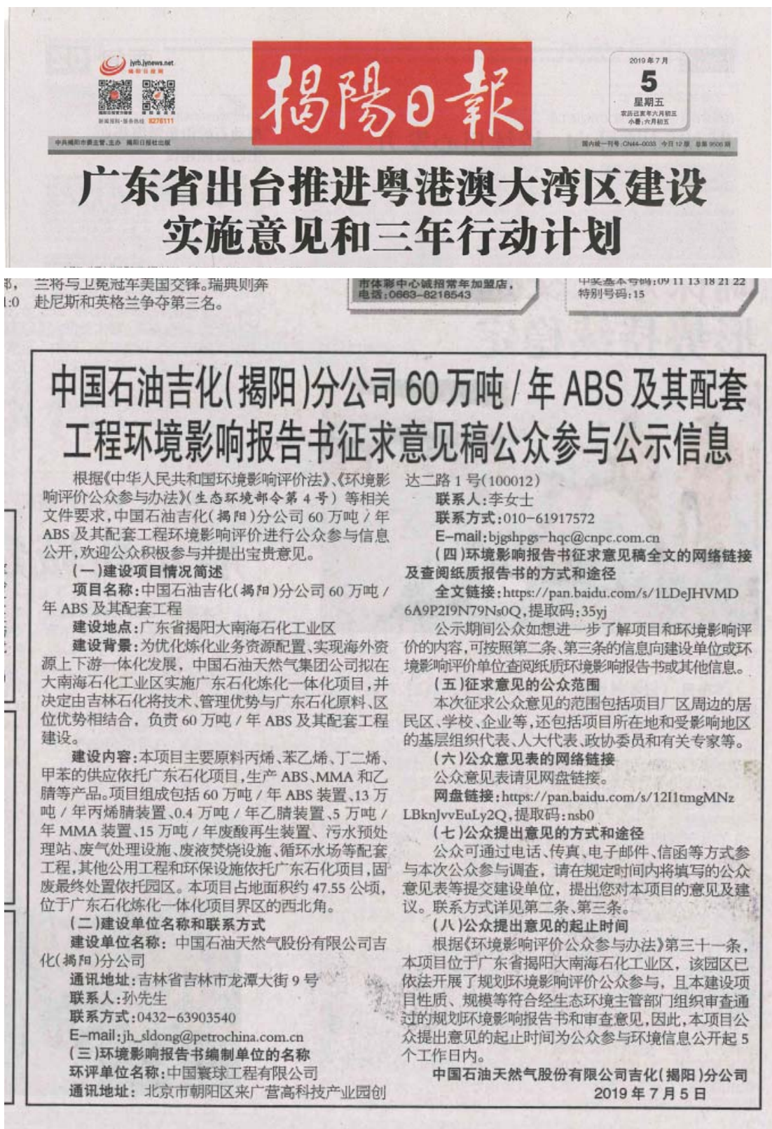
图 3-3 征求意见稿报纸公示 (7 月 5 日)